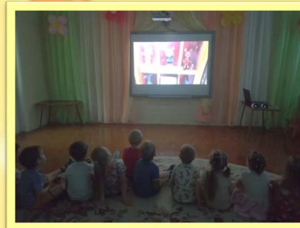
Виртуальная экскурсия в музей мыши в городе Мышкин