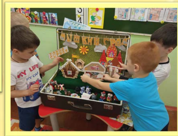
Создание мини музея «Мышкин град»