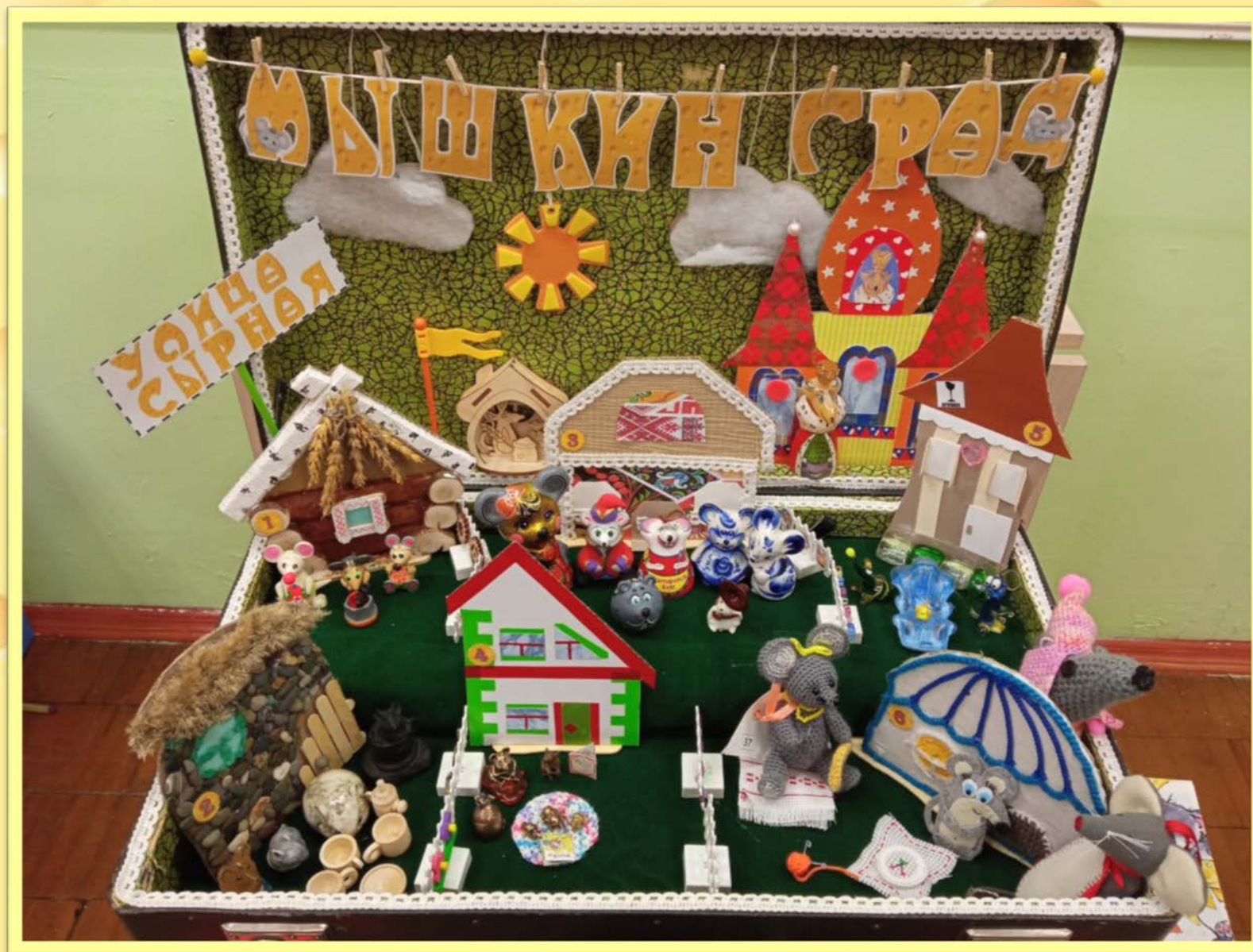
Мини – музей в чемодане «Мышкин град»