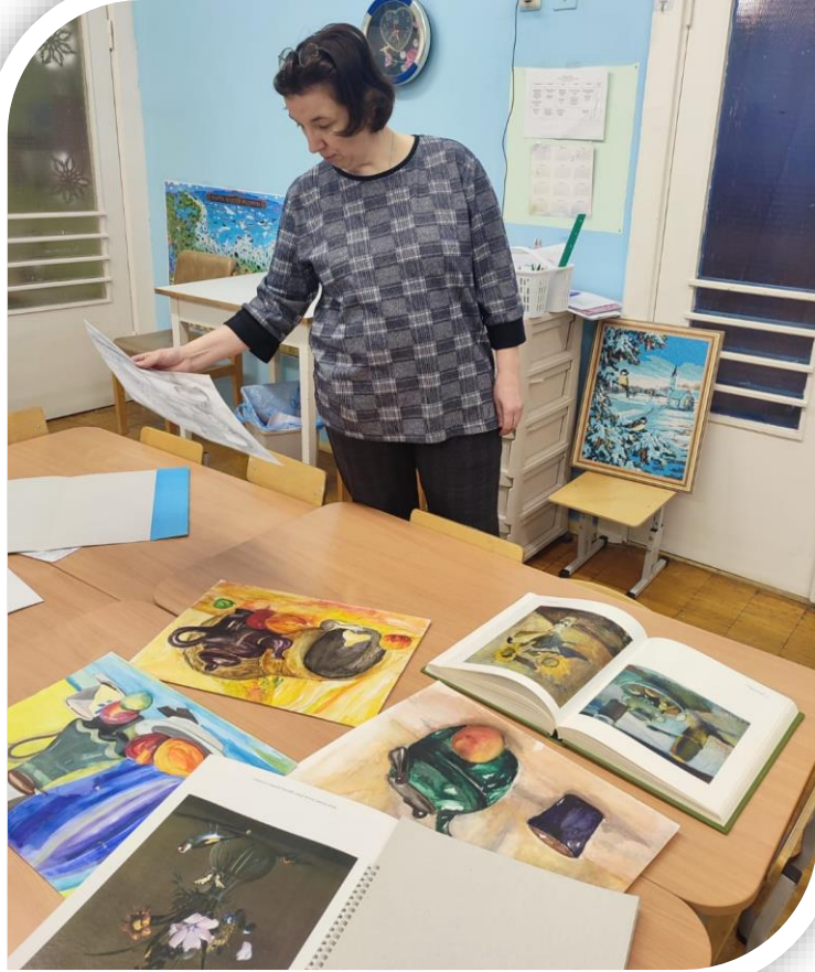
Подбор литературы и наглядно-демонстративного материала