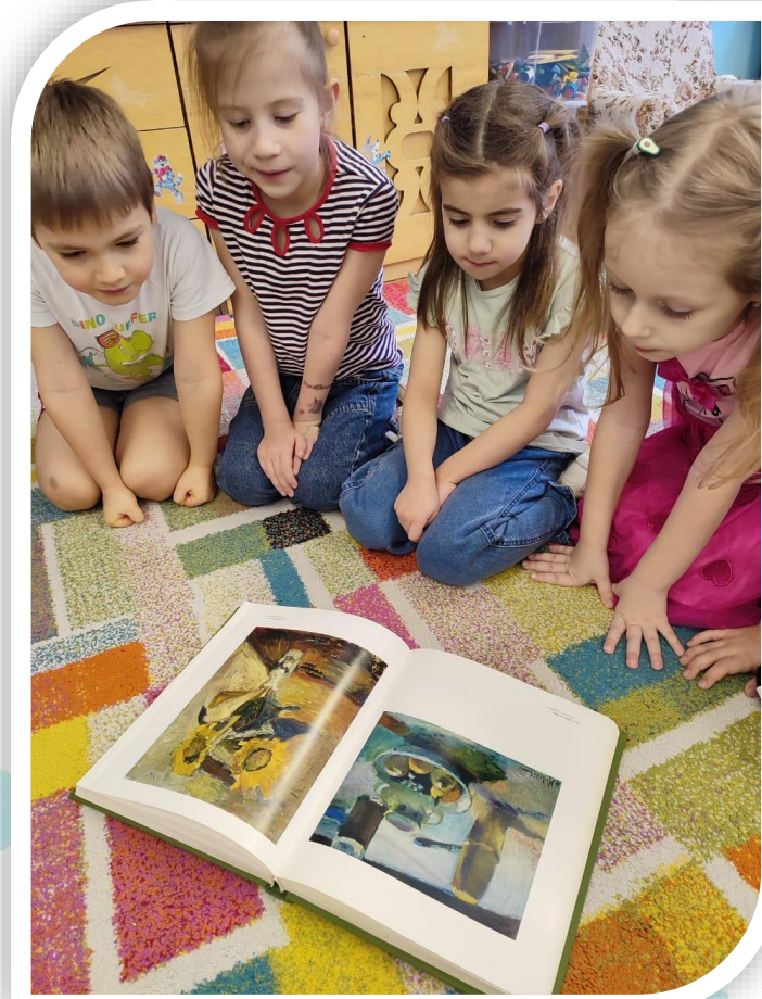
Погружение в тему проекта