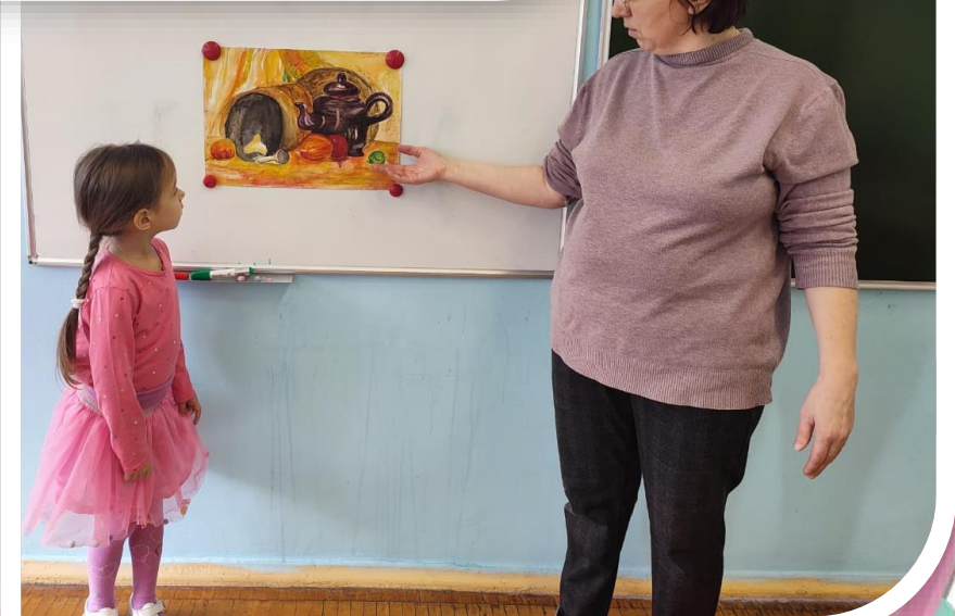
Рассматривание картин по теме