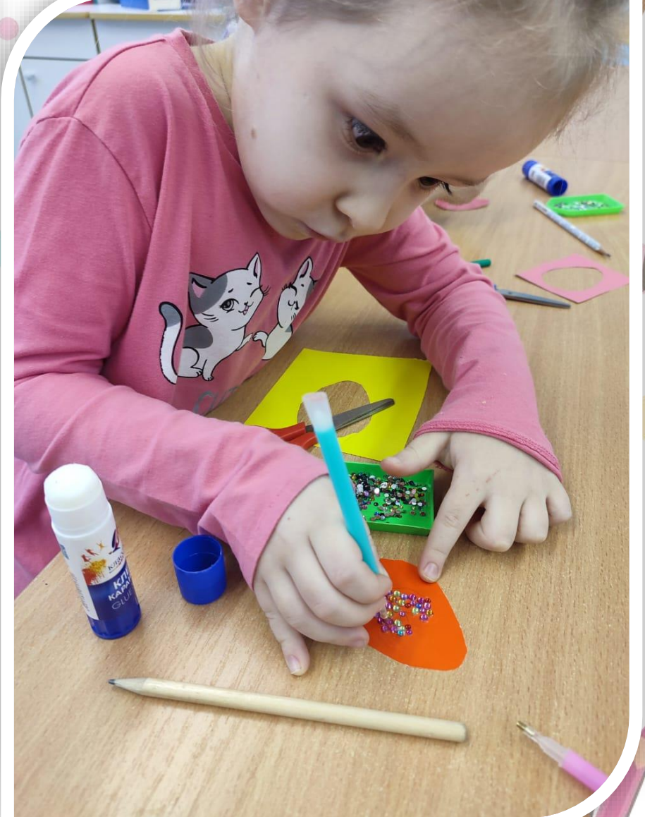
Украшение яйца алмазной мозаикой