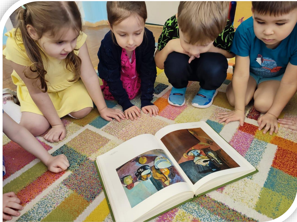
Рассматривание иллюстраций, репродукций