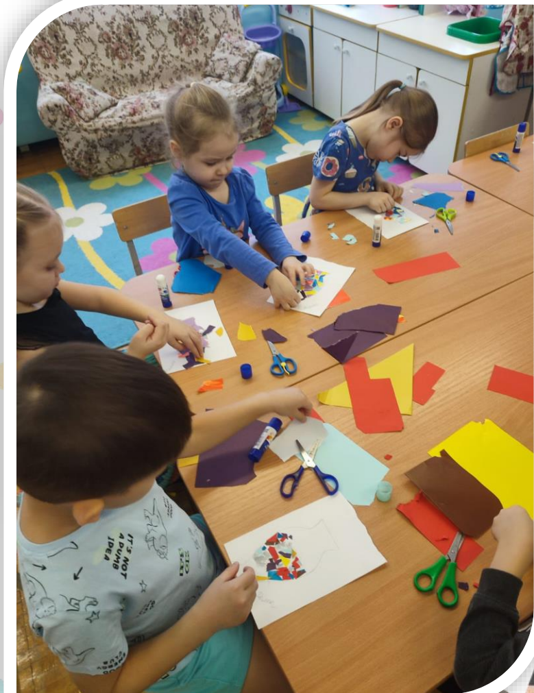
Продуктивная деятельность «Я художник»