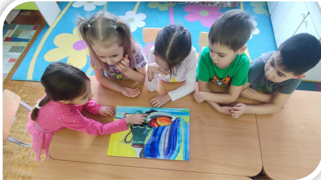
Составление описательного рассказа по картине