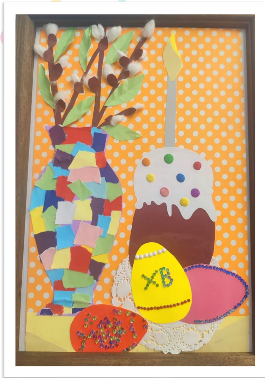
Коллективная работа «Пасхальный натюрморт»