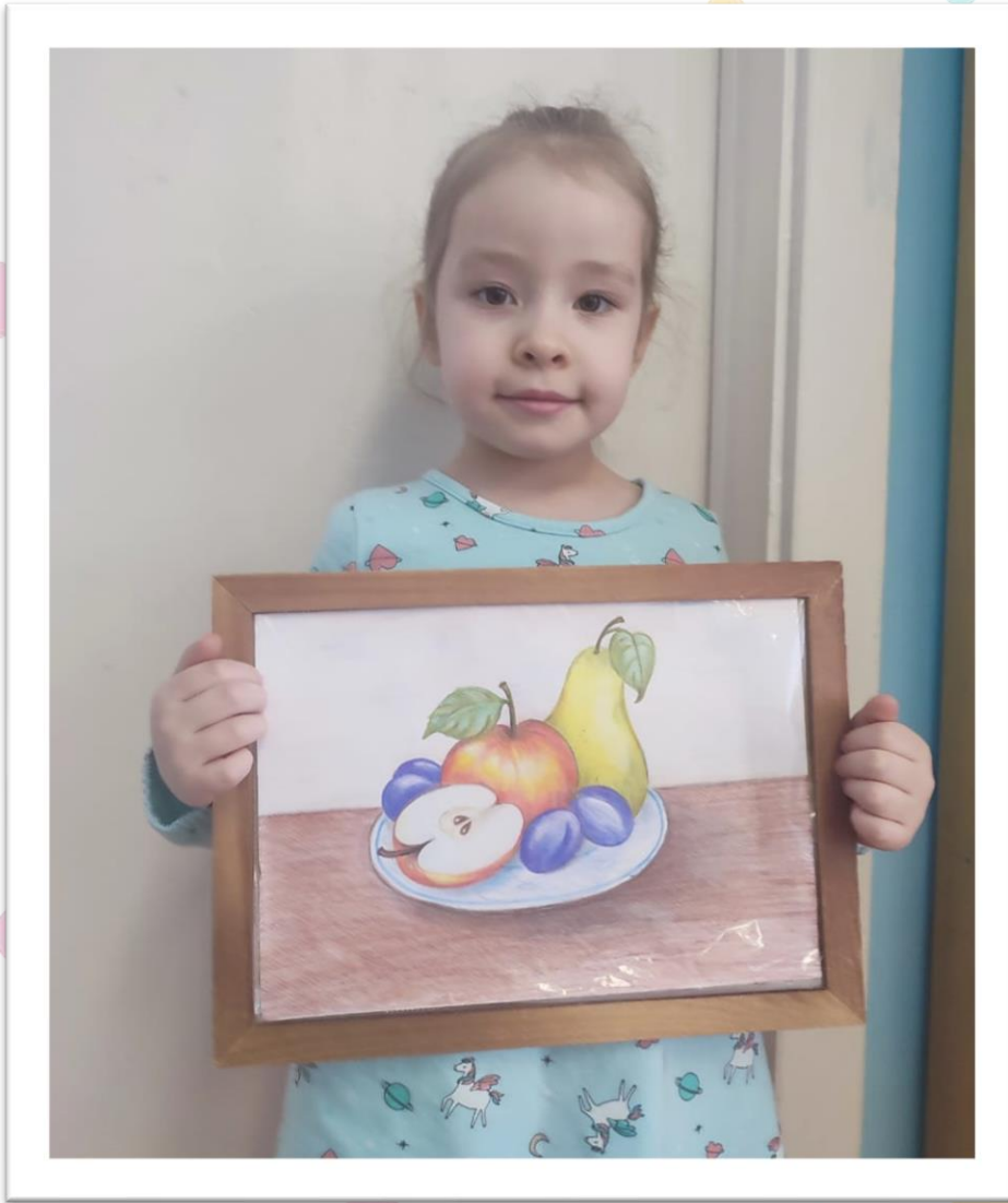
Работа с родителями «Коллективный семейный рисунок «Фрукты на тарелке»»