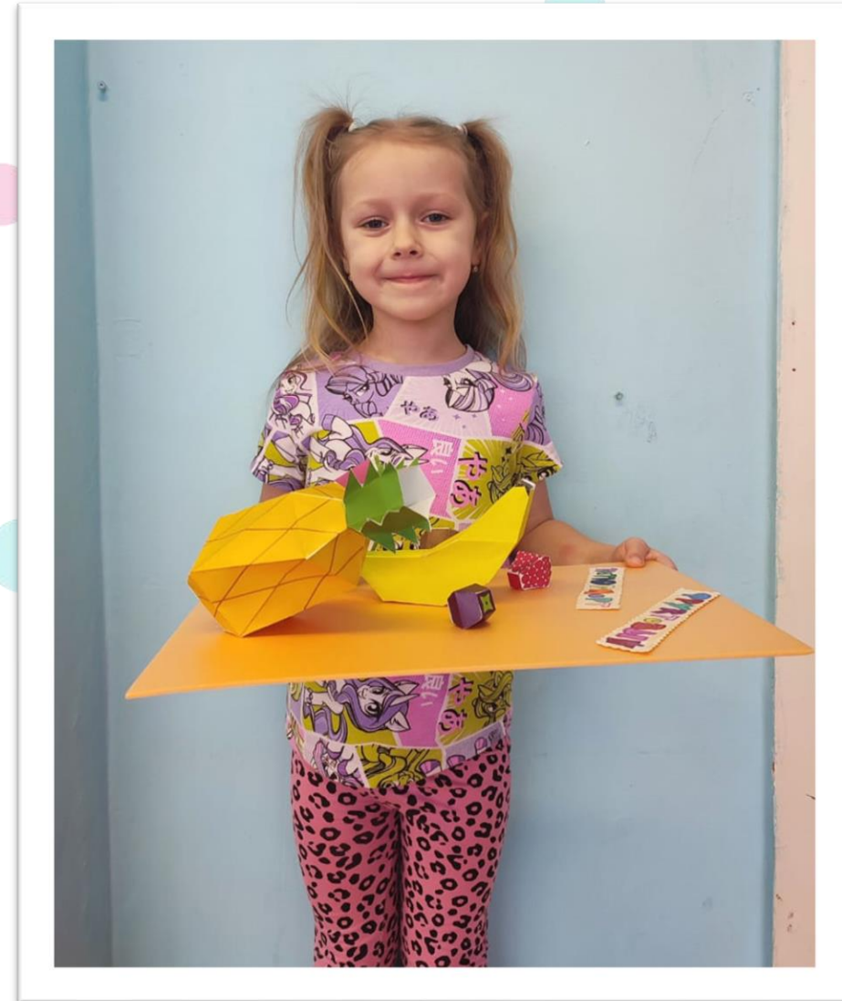
Работа с родителями «Макет фруктов»»