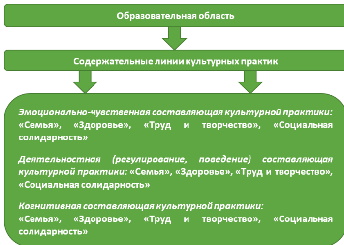
Рис. 2. Модель реализации содержания образовательной области